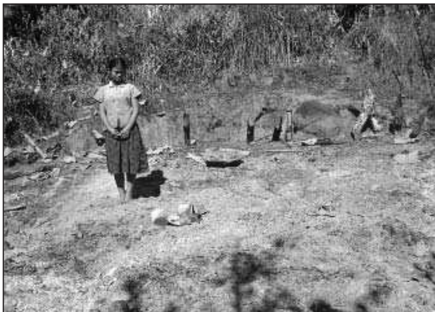
◀ Ruins of a house after Burmese army raid in Thandaung Township, 2006.