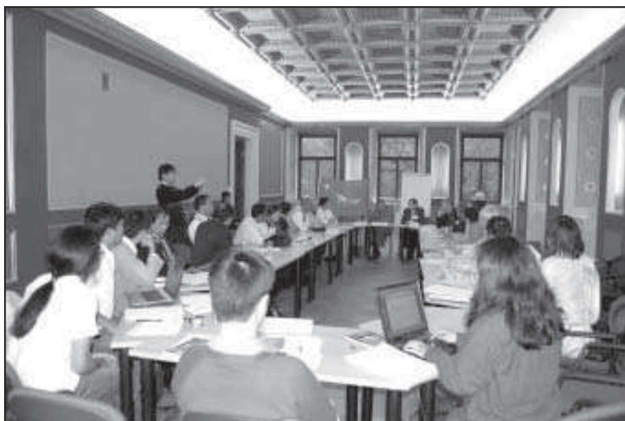
◀ Conference of FBE in Prague, hosted by Burma Center Prague in 2007.

The activities of migrants are naturally often initiated out of a sentiment of concern and responsibility, based on their personal experiences and maintained by a high intake of topical news over a long period of time. Confronted with a lack of skills on how to run a high-profile NGO, they usually consider it a first priority to get off the ground somehow, even if this means diverting all their available funds to the work. Very personal “low budget”