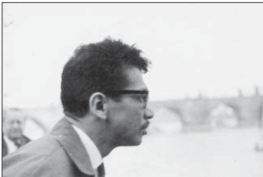
◀ U Minn Latt s autorkou v Praze. ▶

Barmanistka. V letech 1958 - 1960 studovala na rangúnské univerzitě v Barmě. Studium barmanistiky dokončila na filozofické fakultě UK roku 1962. V letech 1960 - 1990 pracovala v Orientálním ústavu ČSAV, kde se zabývala moderní literaturou, kulturou a dějinami Barmy. Nyní vyučuje barmštinu.