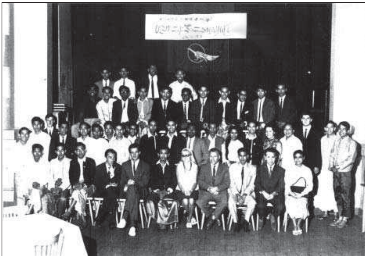
▲ Meeting of Burmese in Prague in the 1960s.

Christoph Amthor studoval v Regensburgu, Readingu a Mnichově. Působil jako žurnalista v několika novinách a jako editor ve Slovenském rozhlasu – mezinárodní vysílání. Je spoluzakladatelem Barmského centra Praha a věnuje se mu většinu svého času jako dobrovolník. V současné době žije v Praze a je doktorandem mediálních studií v Německu.