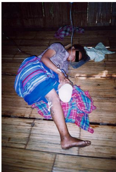
OBĚT NÁŠLAPNÉ MINY