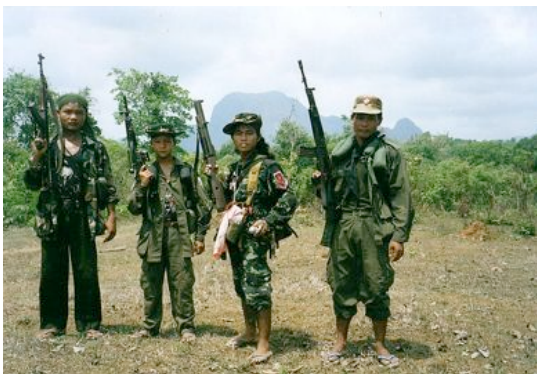
V BARMĚ JE ASI 70.000 DĚTSKÝCH VOJÁKŮ.

I po návratu domů může zodpovědný turista Barmě pomáhat tím, že se zapojí do prodemokratických kampaní, bude šířit povědomí o Barmě nebo jakkoli jinak podporovat boj Barmánců za svobodu. Mlčení, které kolem Barmy obecně panuje, k tomuto vítězství jistě nepřispěje. Také Barmské centrum Praha, o.p.s., uvítá zapojení návštěvníků Barmy do lidskoprávních aktivit, programů a sdílení jejich zážitků a informací ze zapomenuté země.