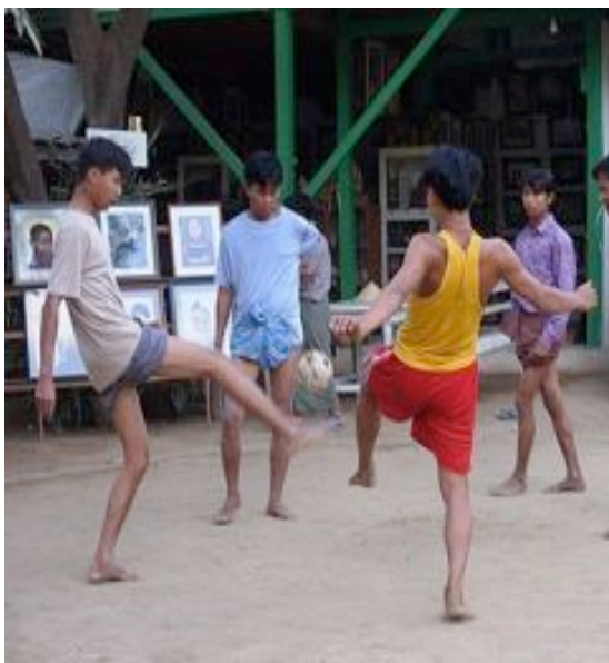
KLUCI HRAJÍ "CHINLONE"

Jde o návštěvy show a různých představení konaných výhradně pro turisty, která devalvují význam dané kulturní akce. V některých případech jsou lidé turistickou atrakcí nedobrovolně a nemají z toho žádné výhody. To se týká etnických minorit a zejména Padaungů, jejichž „žiraf“ ženy a dívky jsou často nuceny nosit mosazné obruče kolem krku jen kvůli penězům od zahraničních návštěvníků.