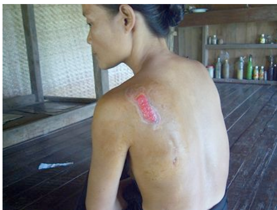
OBĚT NUCENÉ PRÁCE

Toto chování zahrnuje ubytování ve státních hotelech, používání veřejné dopravy (včetně silnic, kde režim vybírá mýtné, přičemž údržbu těchto silnic už musí provádět vesničané sami a na vlastní náklady), využívání služeb státních průvodců a návštěvy památek, kde vstupné jde přímo státu (například Švedagonská pagoda nebo Pagan) a využívání služeb nabízených Myanmar Travel & Tours (MTT), což je turistická kancelář pod vládní kontrolou.